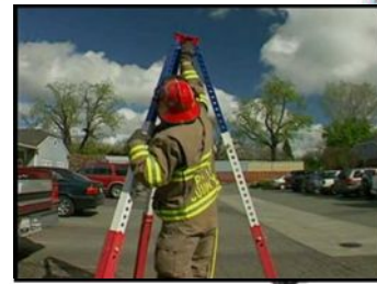
③ フレーム (トリポッド)